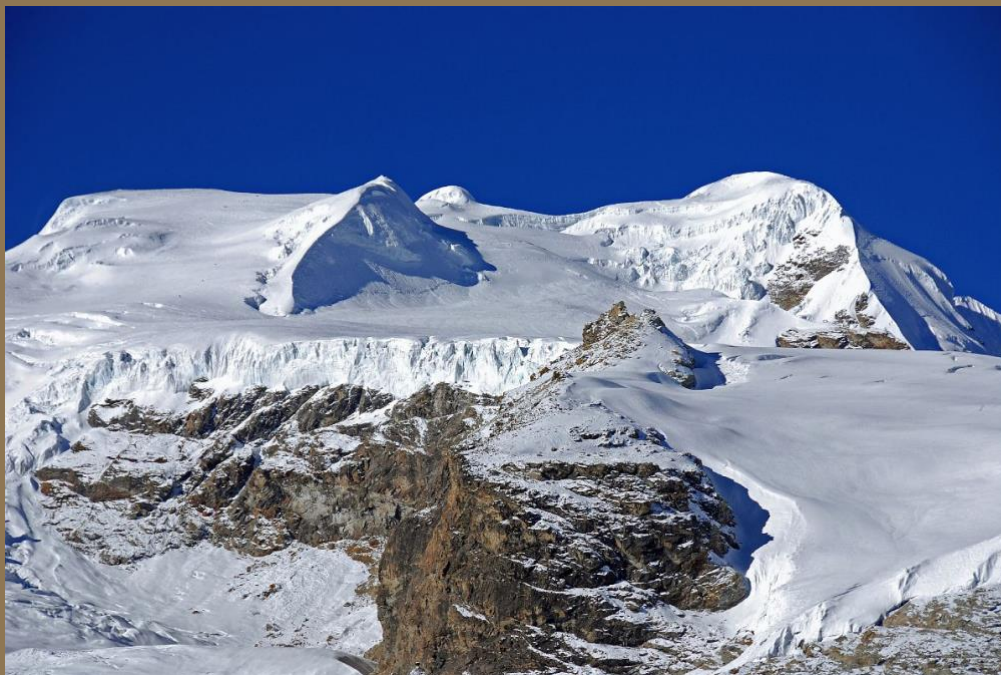
Mera Peak 6461m